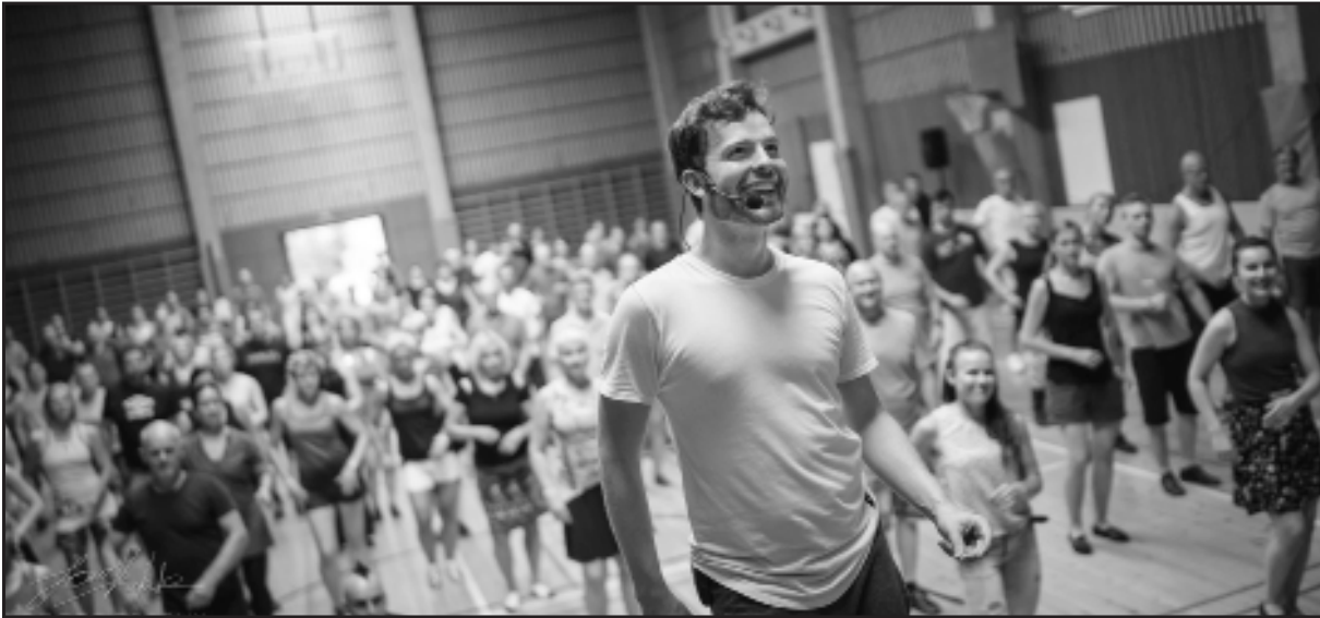
Salsatunti Valasarannan tanssileirillä Yläneellä. Myös tämän jutun kirjoittaja on onnistunut saamaan itsensä kuvaan, tummassa paidassa oikealla.