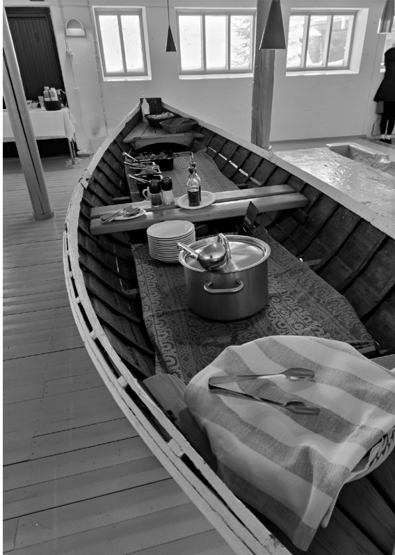
Aamiainen ja lounas tarjottiin talvikoulussa veneen muotoisesta buffet-pöydästä.

tutkimuksessa voidaan pohtia. 1 Luento oli hyvä muistutus siitä valppaudesta, joka helppoja ratkaisuja moniin asioihin tarjoavan tekoälyn käytössä tulee muistaa. Esimerkiksi muiden julkaisemattomia tekstejä ei tule ladata ChatGPT:n tiivistettäväksi, vaikka se voisi helpoudessaan houkuttelevaa ollakin.