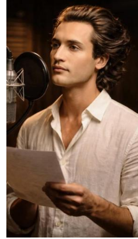
Fig. 2 Eminescu’s AI Doppelgänger

[176 years ago, a great poet was born: Mihai Eminescu. Today, technology allows us to imagine what he might have looked like, how he might have spoken, how he might have recited. But there is something no algorithm can recreate: the talent, the genius, the soul behind the words.]