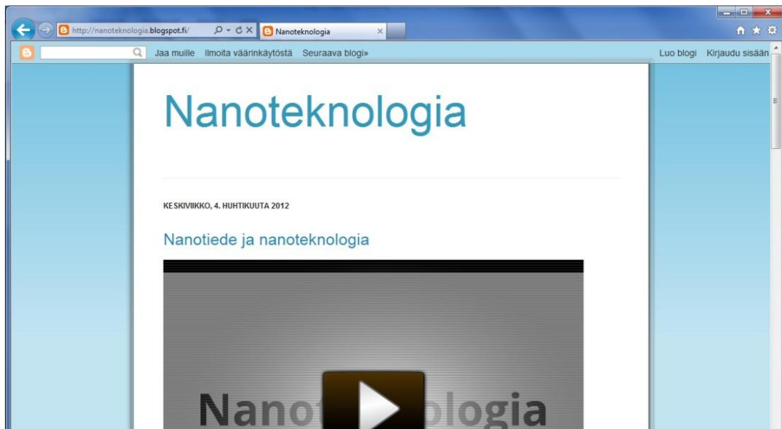
Kuva 2. Nanoteknologia-blogi

tutustua nanotieteen kokoluokkaan sekä nanoteknologian sovelluksiin arkielämän esimerkkien avulla. (vrt. Tretter, 2006)