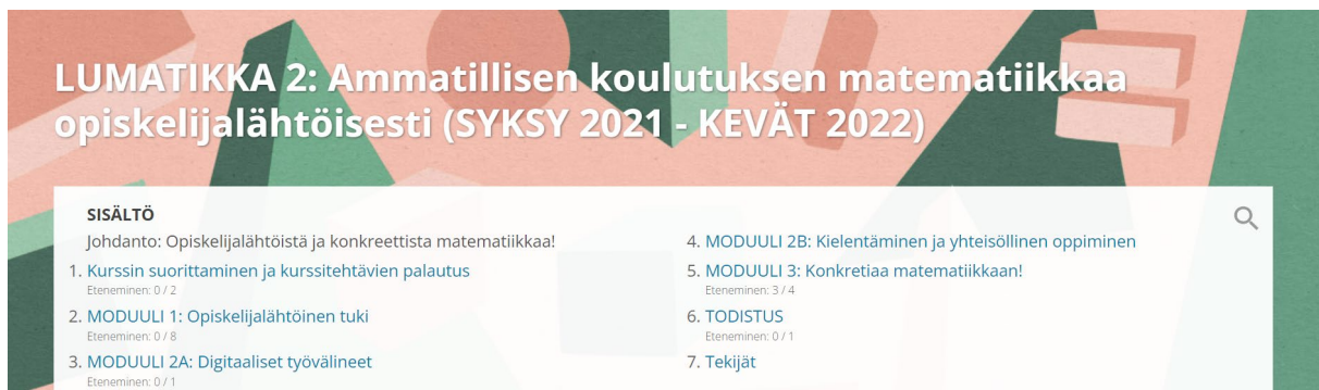
Kuva 1. MOOC-oppimisympäristössä kurssin aloitussivulla oleva kurssikuvaus.

Kurssin sisällöt on jaettu kolmeen moduuliin, missä toinen moduuli on jaettu kahteen vaihtoehtoiseen teemaan. Moduulit näkyvät kurssisisältöä kuvaavassa kuvassa 1.